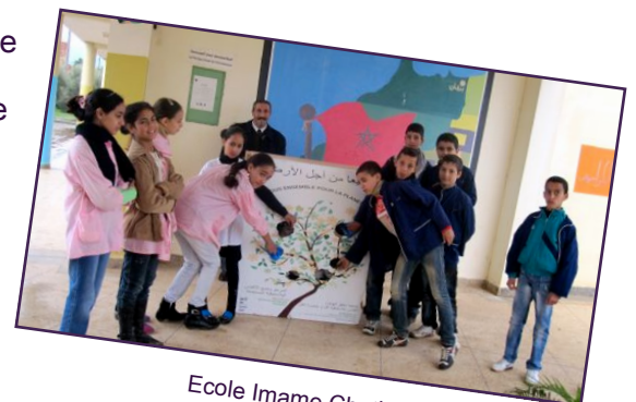
Ecole Imame Chatibi