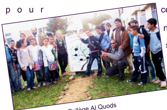
Collège Al Quods

cette année scolaire. De nouvelles campagnes de sensibilisation sont en train d'être mises au point en partenariat avec les directeurs des établissements.