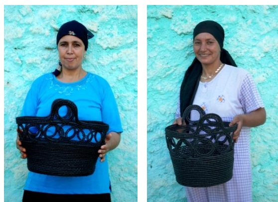
Deux artisanes de la coopérative Najah à Chouhiya

Notre objectif est de faire du recyclage un moteur de l'économie locale en permettant à des femmes en situation précaire de bénéficier de revenus réguliers, tout en protégeant leur environnement.