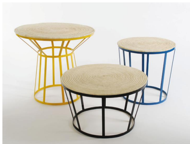
Ci-contre, ces produits ont été développés pour les coopératives de vannerie à Tata