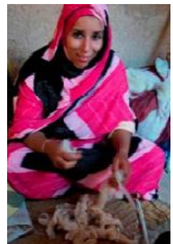
Les artisanes de la coopérative Kafila dans la région de Guelmim