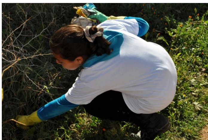
Une élève participe au nettoyage des environs de son école, Chouhiya

Dans un soucis participatif, l'Association du Docteur Fatiha met en place des actions concrètes pour sensibiliser les jeunes générations aux enjeux du développement durable : campagnes de collecte des déchets, campagnes de nettoyage, éco-ateliers, concours sur le thème de l'environnement, etc.